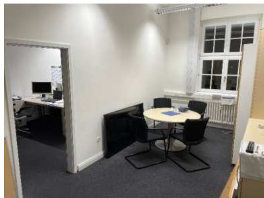
Unsere neue Geschäftsstelle

Leider sind wir noch immer nicht telefonisch erreichbar, aber wir arbeiten daran, besser gesagt, die PSD Bank als Vermieter. Nun heißt es den letzten Rest aus der Burg raus, daher haben wir an zwei Tagen, den 18.11. und den 23.11.2024, zum Räumungsverkauf geladen. Wir hoffen, so viel wie möglich an interessierte FriedenauerInnen für einen selbstgewählten Obolus abzugeben. Also gut erhaltenes Mobiliar, Geschirr, Deckenlampen, ein alter Vitrinenschrank und vieles mehr freuen sich auf eine neue Heimat. Jeder ist herzlich willkommen und kann gerne stöbern. Für alle Friedenauer TSC Mitarbeitende war dann am 12.10. unsere Abschiedsfeier von der Burg. Irgendwie hat man das Gefühl gehabt, etwas zu verlieren, ein Stück Heimat zurückzulassen. Es war schön, mit gut 50 Gästen einen tollen Abend zu erleben, in Erinnerungen zu schwelgen und sich dann am Ende auf das Neue zu freuen. Wer weiß, wohin das Vereinsschiff uns führt. Vielen Dank für alle HelferInnen, die für ein gelungenes Fest gesorgt haben.