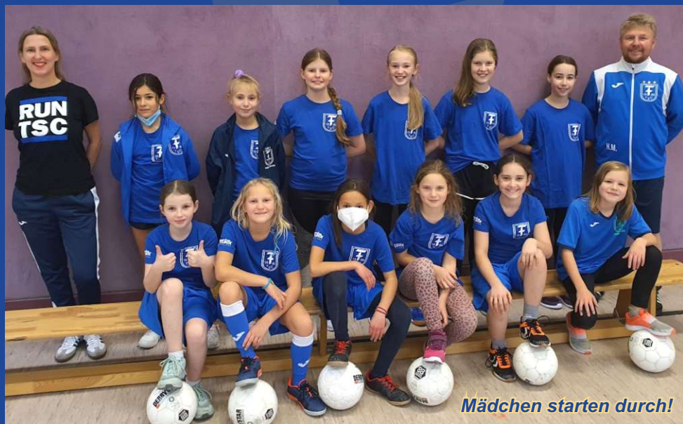
Mädchen starten durch!