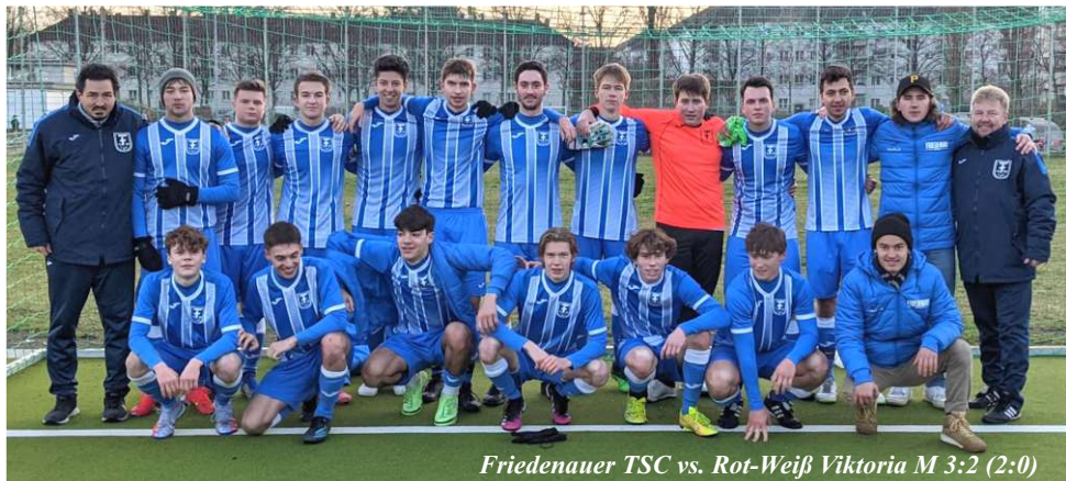
Friedenauer TSC vs. Rot-Weiß Viktoria M 3:2 (2:0)