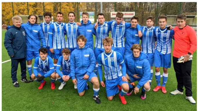
SF Johannisthal - Friedenauer TSC 1:2