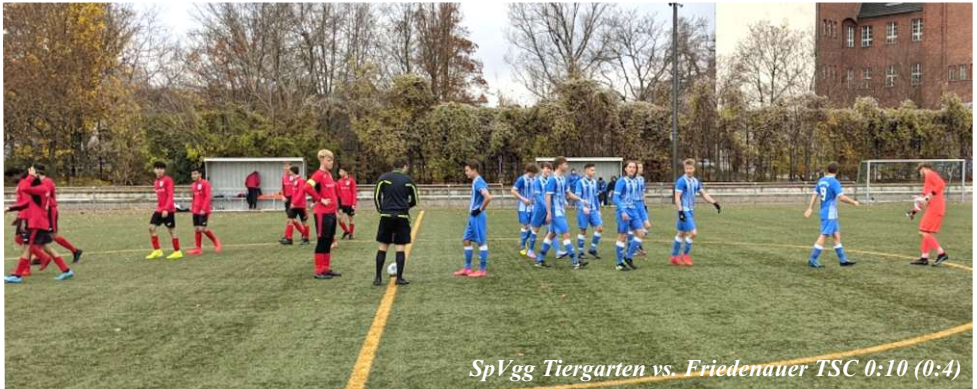
SpVgg Tiergarten vs. Friedenauer TSC 0:10 (0:4)

sein können. Nach der Pause war es dann wieder Oskar, der in der 47. Minute das 0:5 markierte und damit im ersten Spiel ein Doppelpack schnürte. In der 50. Minute bekamen wir einen Strafstoß zugesprochen, der Gefoulte trat selbst an, aber konnte den Ball nicht am Torwart vorbeibringen. In der 57. Minute schnürte auch Iven seinen Doppelpack zum 0:6 und auch Till machte mit dem 0:7 einen Doppelpack. In der 67. Minute schoss uns Fritz zum 0:8. Auch Mika wollte sich in die Torschützenliste eintragen und schoss in der 78. Minute das 0:9. Das letzte Tor des Spiels, das 0:10 markierte Til in der 84. Minute. Das Ergebnis hätte weitaus höher ausfallen können, wenn die Chancenverwertung besser gewesen wäre. Damit haben wir einen großen Schritt zum ersten Tabellenplatz nach der Hinrunde gemacht.