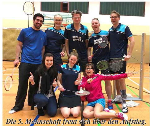
Die 5. Mannschaft freut sich über den Aufstieg.

Am 17.02.2019 war es wieder soweit: beim traditionellen Schleifchenturnier ging es um die Schleifen, veranstaltet vom Badminton-Club Tempelhof. Die Atmosphäre war wie immer locker und die Stimmung gut. Das Spaßturnier findet nach Möglichkeit zweimal jährlich statt. Einmal zu Beginn des Jahres ausgerichtet vom Badminton-Club Tempelhof und einmal im Herbst, ausgerichtet vom Friedenauer TSC. Bevor die Schleifen verteilt wurden, fand nach guter Tradition zunächst wieder das Eltern-Kind-Turnier statt. Jedes Kind durfte mit einem Elternteil, Tante, Onkel oder gutem Freund der Familie ein Team bilden und am Turnier teilnehmen. Es gab interessante Matches bei beiden Turnieren und am Ende konnten sich noch alle am selbst organisierten Buffet stärken und das