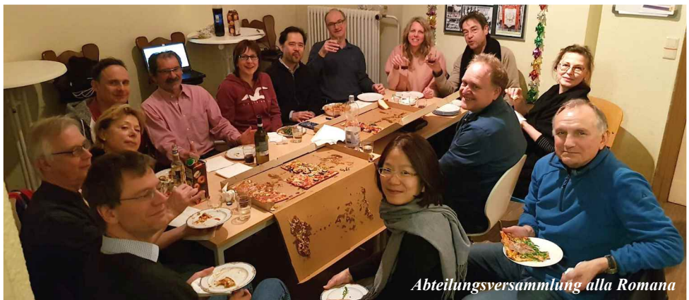
Abteilungsversammlung alla Romana