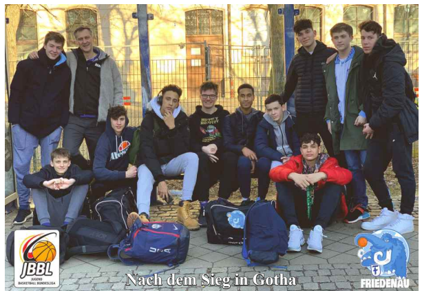
Nach dem Sieg in Gotha