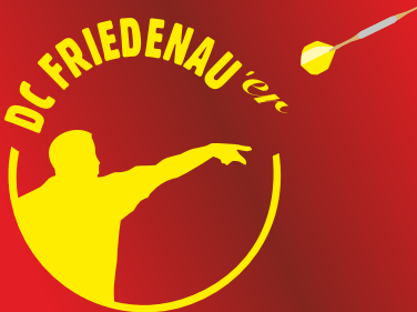
DC Friedenauer I (A-Liga) DC Friedenauer II (B-Liga)