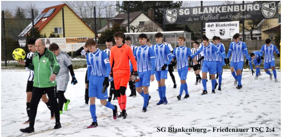
SG Blankenburg - Friedenauer TSC 2:4