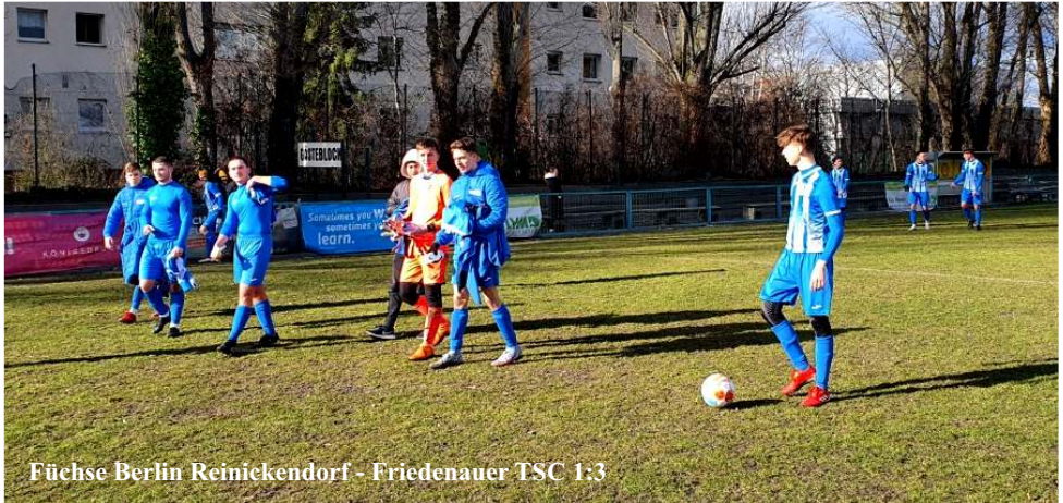
Füchse Berlin Reinickendorf - Friedenauer TSC 1:3

Matti, danke schön fürs aushelfen beim Pokalspiel und heute.