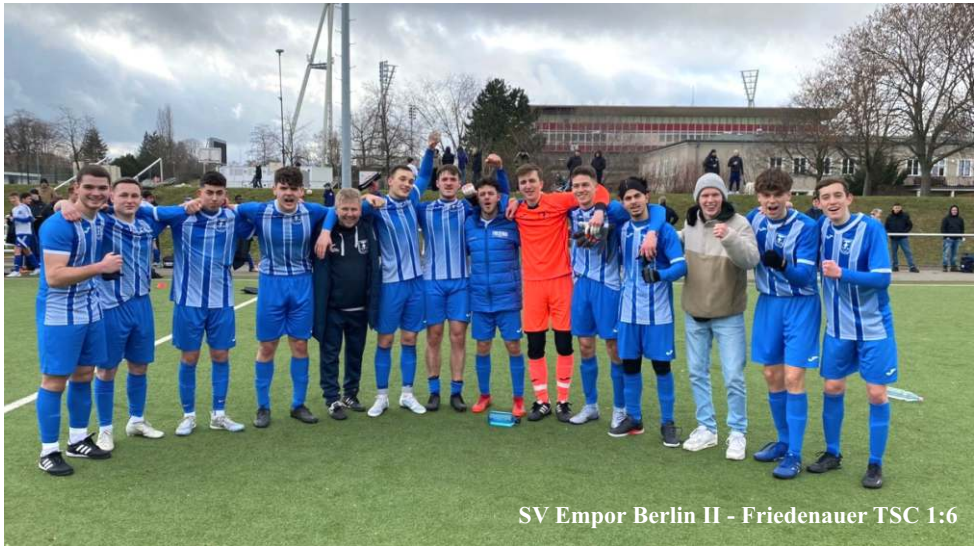
SV Empor Berlin II - Friedenauer TSC 1:6

Wehmutsstropfen ist allerdings, die aus unserer Sicht völlig unberechtigte rote Karte gegen unseren Lino. Wir werden ihn am Mittwoch im Pokalspiel gegen den TSV Rudow schwerlichst vermissen. Anstoß ist in Rudow um 19:30 Uhr.