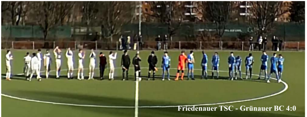
Friedenauer TSC - Grünauer BC 4:0

Der Verband sollte überlegen, ab Landesliga A-Jugend immer ein Schiedsrichtergespann anzusetzen.